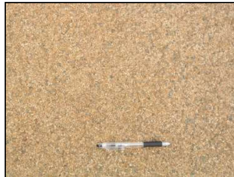
施 工 面