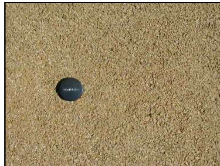
施 工 面