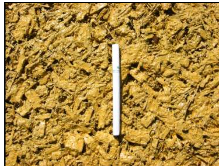
施 工 面