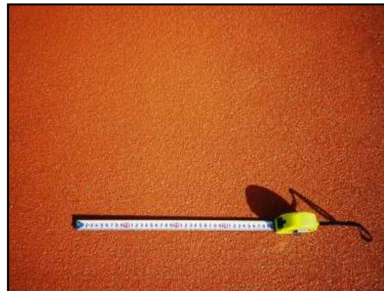
施 工 面