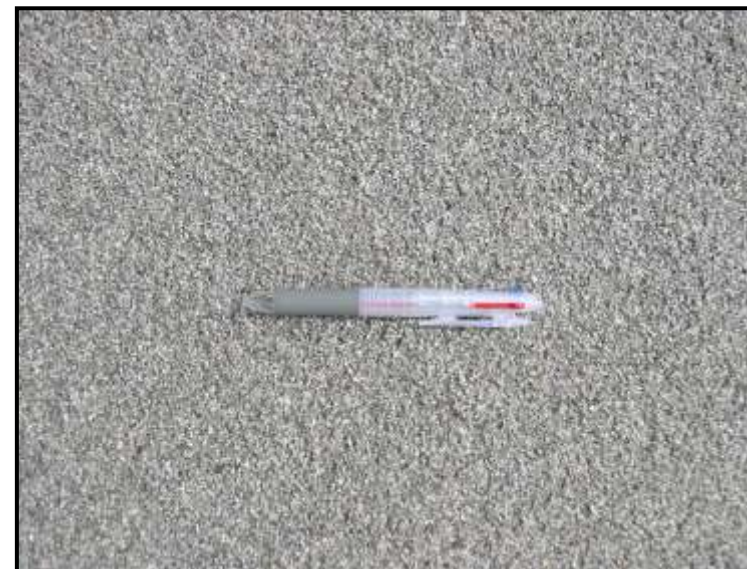
施 工 面