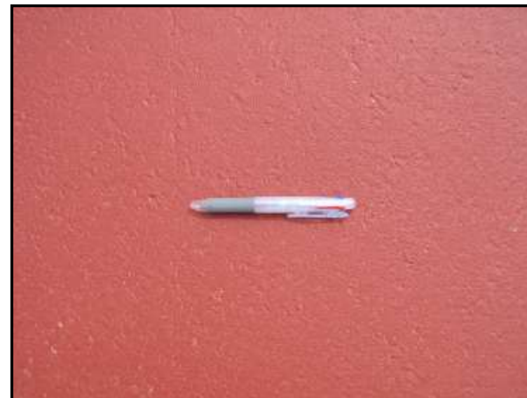
施 工 面