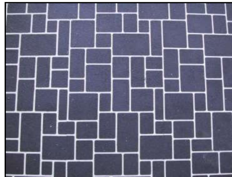
施 工 面